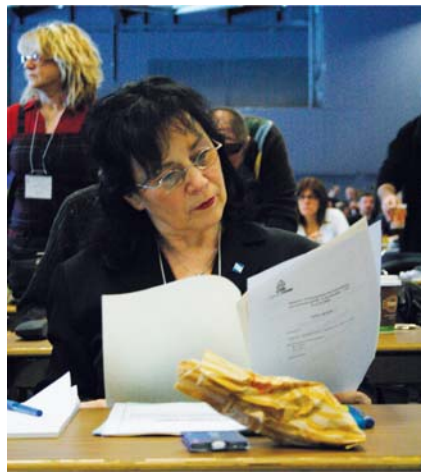
Le 8 avril, les délégué-es des quatre fédérations CSN ont étudié attentivement le cahier de demandes de table centrale à être soumis aux syndicats

Le climat économique difficile ne doit surtout pas freiner notre mobilisation ni diminuer notre détermination. Nos demandes sont réalistes et légitimes. Un règlement négocié permettrait de régler certains problèmes au bénéfice de toute la société québécoise et de renforcer nos services publics. Investir dans les services publics est un moyen parmi les plus efficaces pour relancer l'économie sur des bases plus durables et plus saines.